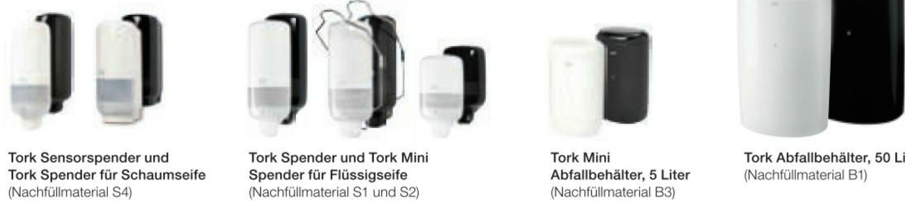
Tork Sensorspender und Tork Spender für Schaumseife (Nachfüllmaterial S4) | Tork Spender und Tork Mini Spender für Flüssigseife (Nachfüllmaterial S1 und S2) | Tork Mini Abfallbehälter, 5 Liter (Nachfüllmaterial B3) | Tork Abfallbehälter, 50 Liter (Nachfüllmaterial B1)