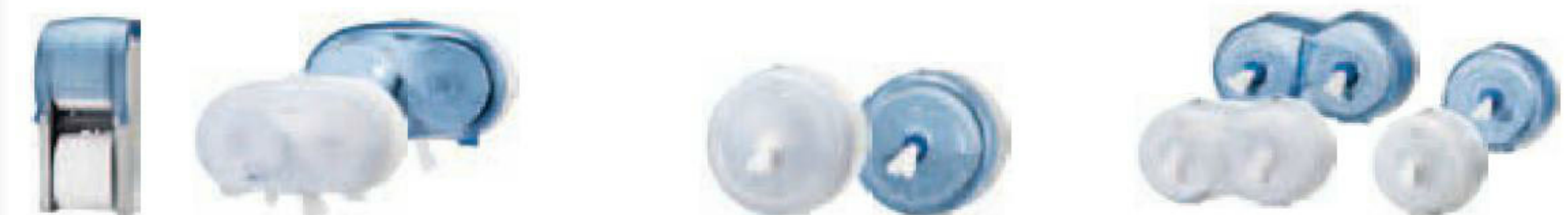
Tork Doppelrollenspender für hülsenloses Midi Toilettenpapier (Nachfüllmaterial T7) | Tork SmartOne® Spender für Toilettenpapier (Nachfüllmaterial T8) | Tork SmartOne® Mini Spender und Mini Doppelrollenspender für Toilettenpapier (Nachfüllmaterial T9)