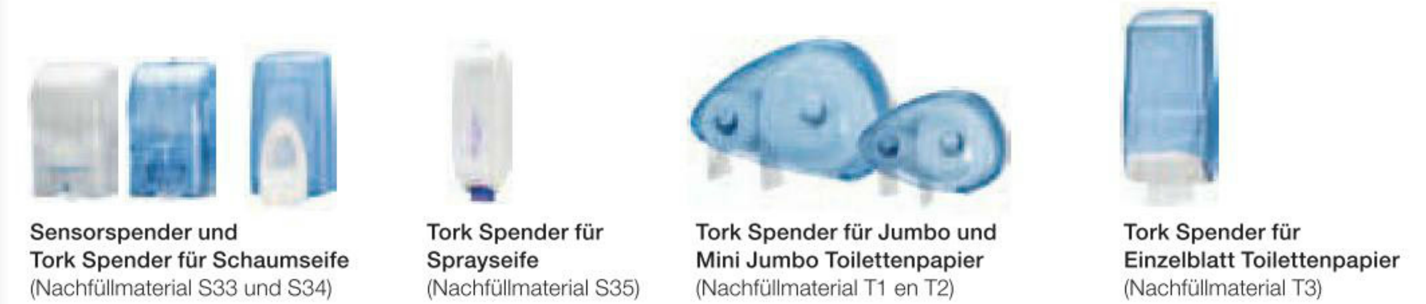
Sensorspender und Tork Spender für Schaumseife (Nachfüllmaterial S33 und S34) | Tork Spender für Sprayseife (Nachfüllmaterial S35) | Tork Spender für Jumbo und Mini Jumbo Toilettenpapier (Nachfüllmaterial T1 en T2) | Tork Spender für Einzelblatt Toilettenpapier (Nachfüllmaterial T3)