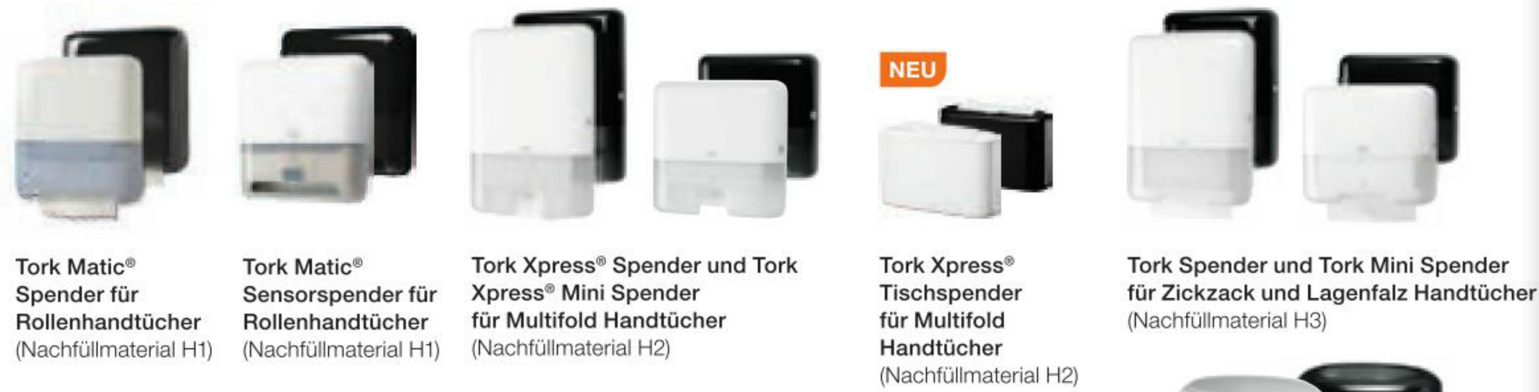
Tork Matic® Spender für Rollenhandtücher (Nachfüllmaterial H1) | Tork Matic® Sensorspender für Rollenhandtücher (Nachfüllmaterial H1) | Tork Xpress® Spender und Tork Xpress® Mini Spender für Multifold Handtücher (Nachfüllmaterial H2) | NEU Tork Xpress® Tischspender für Multifold Handtücher (Nachfüllmaterial H2) | Tork Spender und Tork Mini Spender für Zickzack und Lagenfalz Handtücher (Nachfüllmaterial H3)