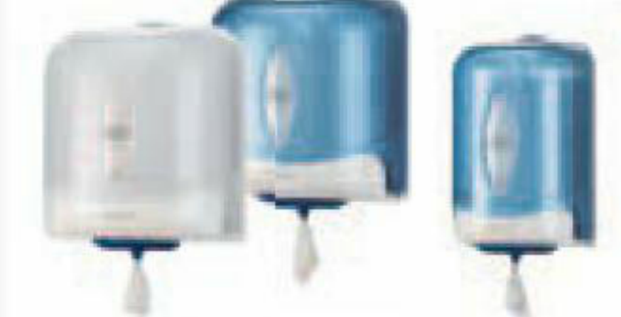
Tork Reflex® Einzelblatt und Einzelblatt Mini Innenabrollungsspender* (Nachfüllmaterial M4 und M3)