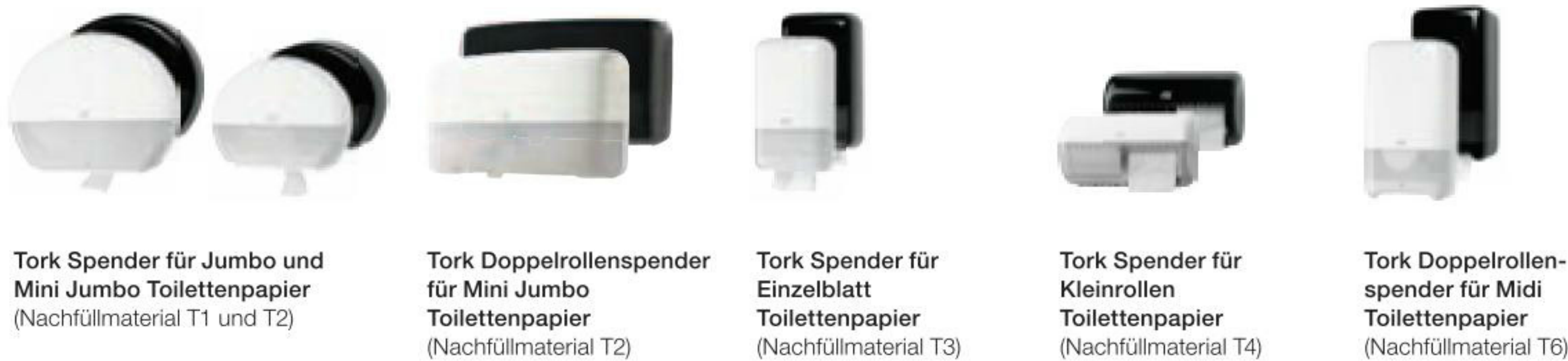
Tork Spender für Jumbo und Mini Jumbo Toilettenpapier (Nachfüllmaterial T1 und T2) | Tork Doppelrollenspender für Mini Jumbo Toilettenpapier (Nachfüllmaterial T2) | Tork Spender für Einzelblatt Toilettenpapier (Nachfüllmaterial T3) | Tork Spender für Kleinrollen Toilettenpapier (Nachfüllmaterial T4) | Tork Doppelrollenspender für Midi Toilettenpapier (Nachfüllmaterial T6)