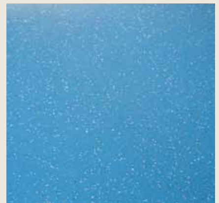
Ein sauberes Ergebnis