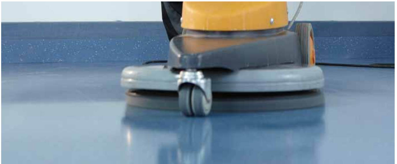
Veredelung. Beläge erst reinigen und auf Hochglanz polieren