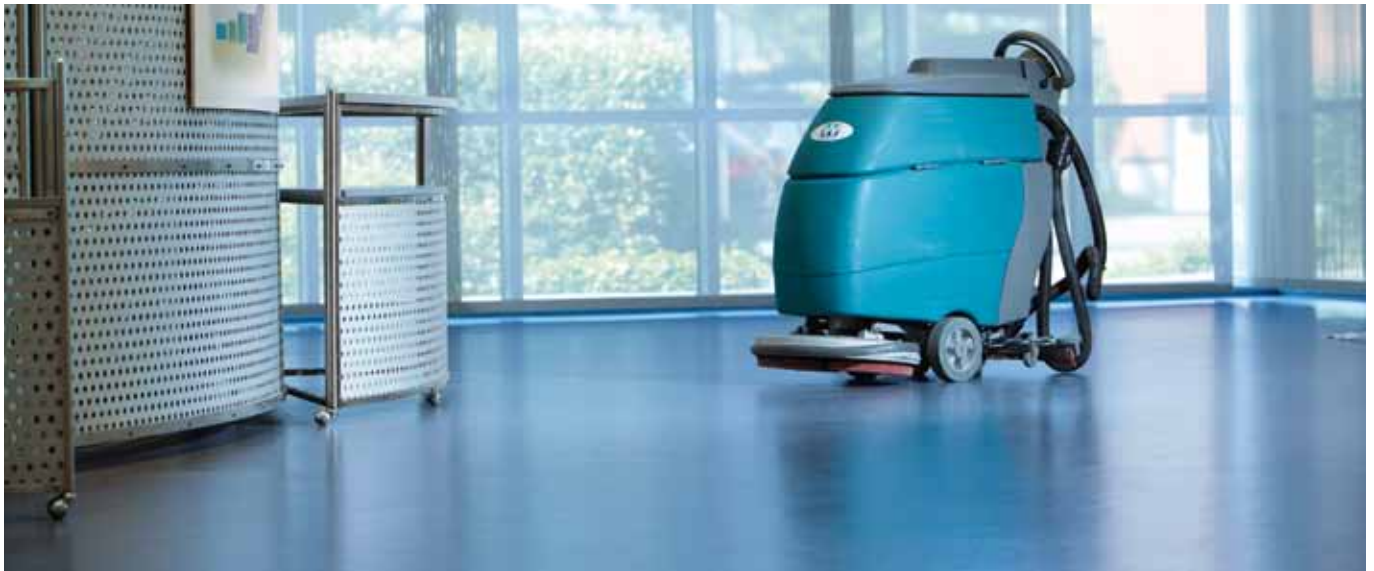
Reinigung. Von der täglichen Pflege bis zur Intensivreinigung