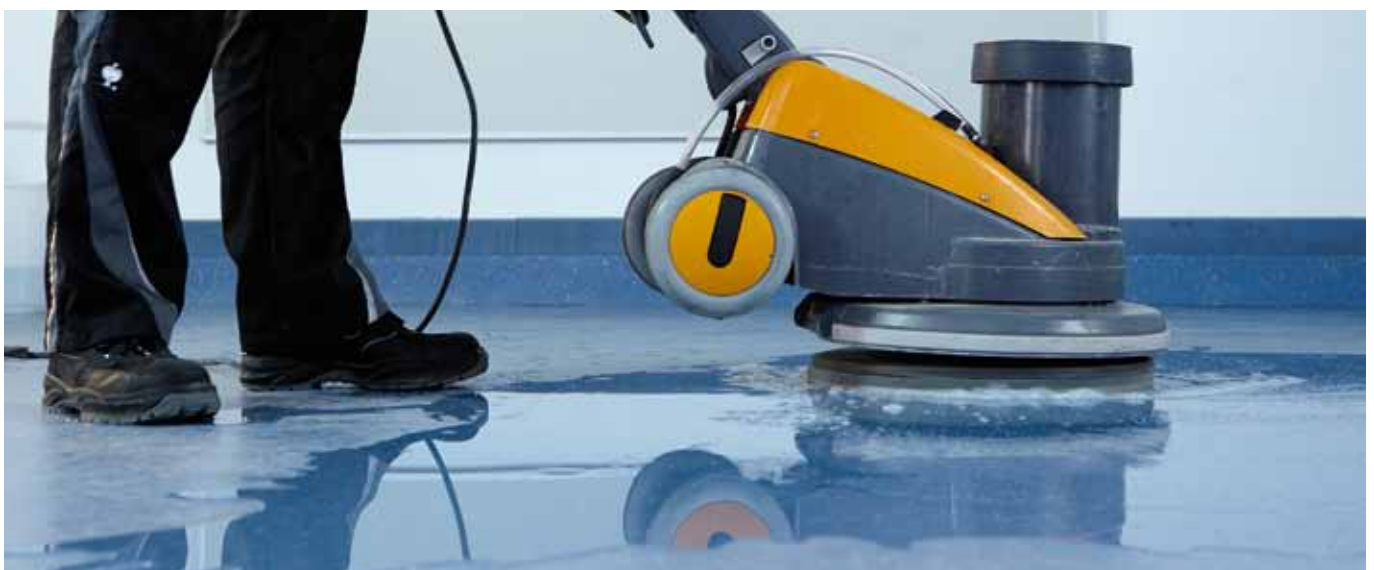
Instandsetzung. Beseitigung von hartnäckigstem Schmutz und Verkratzungen