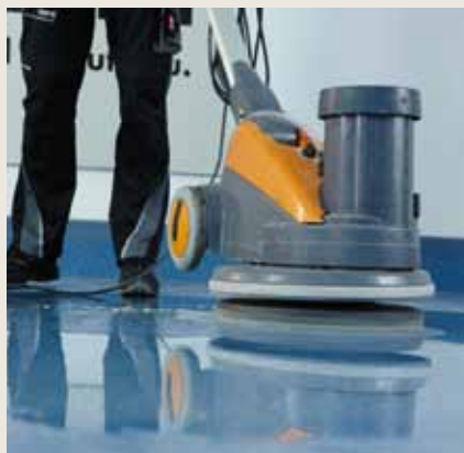
Belag mit nora® pads reinigen