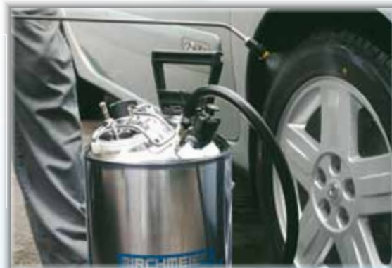
für Gewerbe und Industrie

Bezugsquelle: Ihr Birchmeier-Vertriebspartner