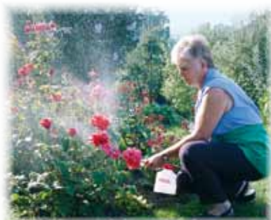
für Garten und Landwirtschaft